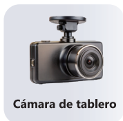
Cámara de tablero