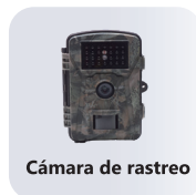
Cámara de rastreo