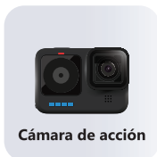
Cámara de acción